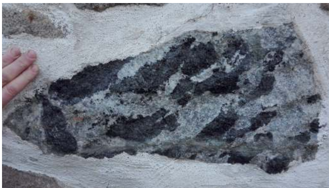
Spændende sten i en væg