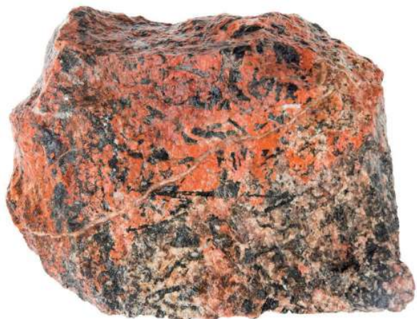
In situ blok fra Alnö (15 cm)