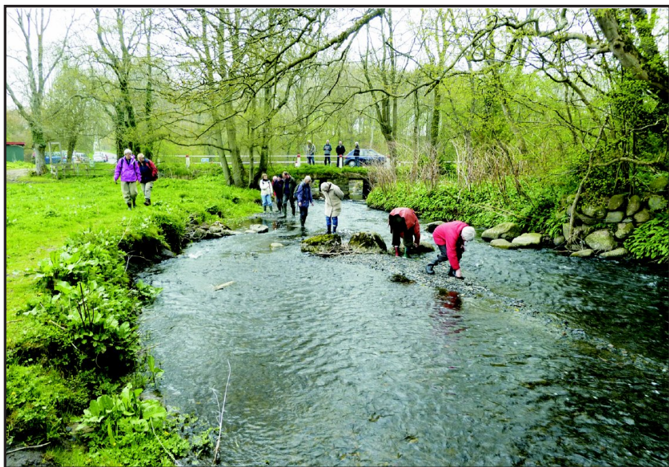
Fossiljagt i Læsåen til nattergaleakkompagnement