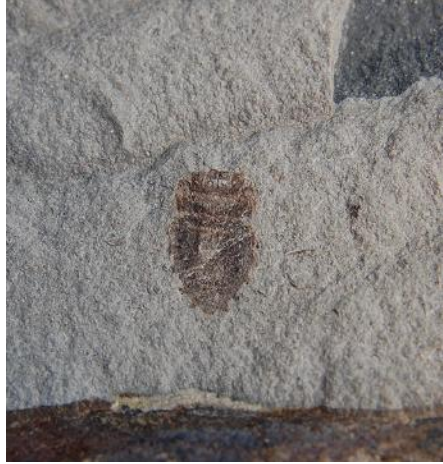
Begge plader af samme fossil, fundet ved knudeklinten på Fur af Susanne Schmidt

Bredtæger, med deres karakteristiske ”skaktern” i randen af bagkroppen, er sammen med afrevne fluevinger, molerets almindeligste insekfund. De findes hyppigst og bedst bevaret i molerets hårde cementsten. Tæger er såkaldte næbmundede insekter, der omfatter såvel plantesugere som rovdyr. Tægerne lever både på land og i vand og varierer i form fra små billelignede insekter, brede såvel som smalle, til specialiserede vandinsekter som rygsvømmere og skjoteløbere. Alle disse former er godt repræsenterede i moleret. Der kendes indtil videre 11 forskellige familier af tæger, hvoraf de hyppigste som nævnt er bredtægerne. De kaldes for bredtæger, efter deres kropsfacon eller for stinktæger, fordi mange udskiller ildelugtende kemiske forbindelser ved forstyrrelse. Bredtægerne og flere andre tæger kan ud over ”skakternene” også kendes på at der på rygskjoldet, ved basis af vingerne, findes en trekantet plade. Løsrevne vinger af tæger er i øvrigt også karakteristiske, idet de er læderagtige ved basis og hindeagtige i spidsen, hvilket også kan erkendes på fladtrykte fossiler.