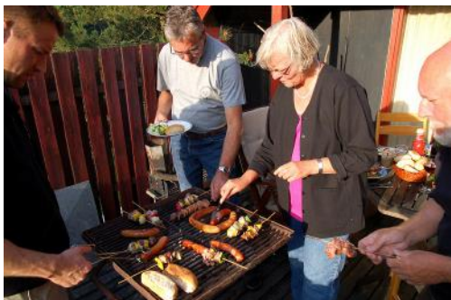
Grillfest St. Hans aften på Fur