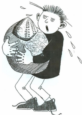
Sakset fra Fynske Fossilsamleres postkort