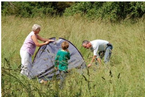
Det er vist længe siden, de har slået telt op