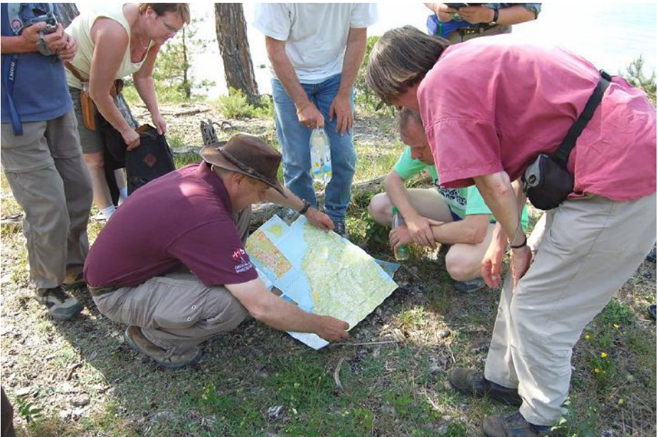
Kortet studeres inden næste lokalitet