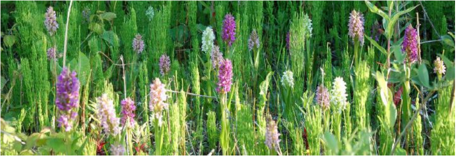
Hvid- og kødfarvet gøgeurt ved Lusklint/Lunds Klint

Når vi ikke orkede mere, var der heldigvis mulighed for at beundre floraen, og med Tages hjælp fik vi bestemt en del orkideer og andre sjældne vækster. De, som gjorde størst indtryk på mig, var Rød skovlilje med store blomster, 'Krutbrännare' eller Bakke-gøgeurt med det flotte farveskift, og Rederod, som ikke har bladgrønt, men mærkelige brune farver, selv i fuld blomst.