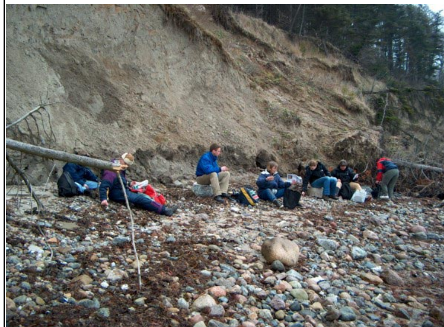
Fra det naturskønne område ved As Hoved nær Juelsminde