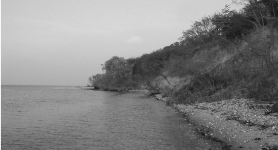
Parti af Røjle Klint på Nordvestfyn

HUSK Hvis det er et problem med f.eks. kørsel, så ring til turlederen eller et af bestyrelsesmedlemmerne. Der er altid nogen, der har en ekstra plads.