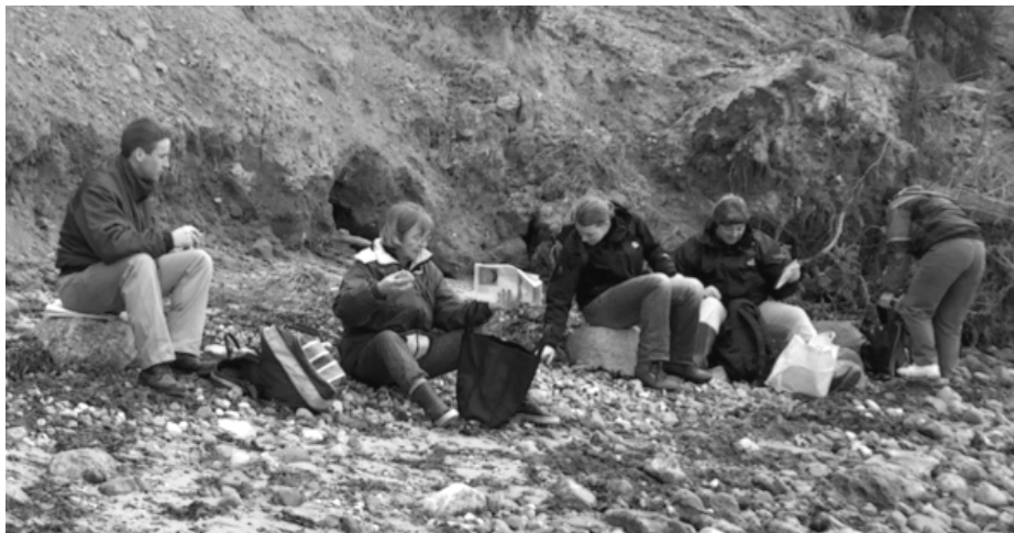
Frokost under klinten ved As Hoved

Lørdag d. 12. april begav foreningen sig af sted på årets første ekskursion. Vi satte kursen mod Juelsminde, nærmere betegnet As Hoved.