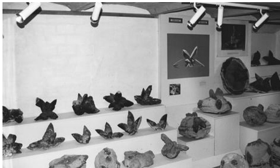
Fra den flotte samling af calcitkrystaller på Molermuseet