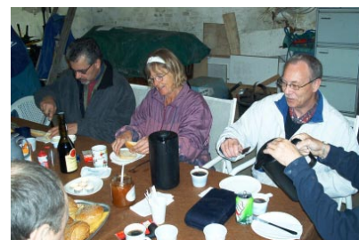
Stenhuggerne varmer op