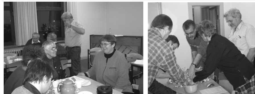
Indtryk fra generalforsamlingen, der var stor søgning ved det amerikanske lotteri