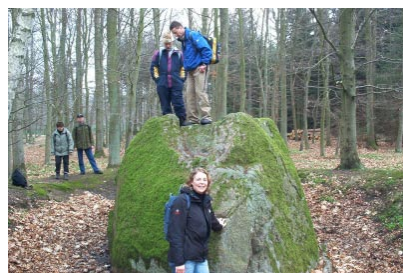
Den store sten på vejen til As Hoved