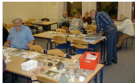
Sten på bordet