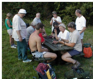
Ved Strandegårds Dyrehave