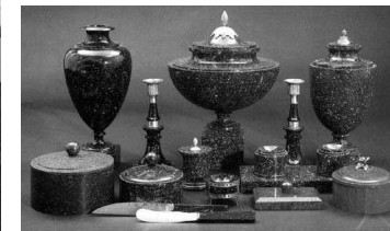
Eksempler fra Porfyrværket