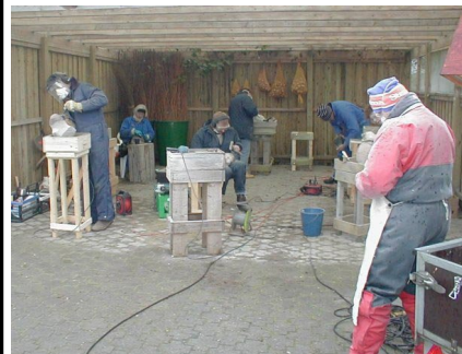
Stenhugning i det kolde efterår