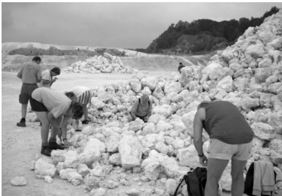
Der kom hurtigt gang i værktøjet i det hårde koralkalk i Fakse kalkbrud

Vi boede på en nedlagt ejendom med et stort, moderniseret stuehus. Her var masser af plads, spisestue, opholdsstue, stort køkken med alle moderne hjælpemidler, badeværelser og flere soveværelser. Ejendommen var indrettet som kursejendom, så det var alle tiders sted.