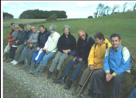
Et lille hvil på turen til Melbjerg Hoved