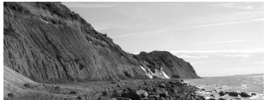
Det flotte profil ud mod Limfjorden.