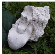
Nautil fra Fakse