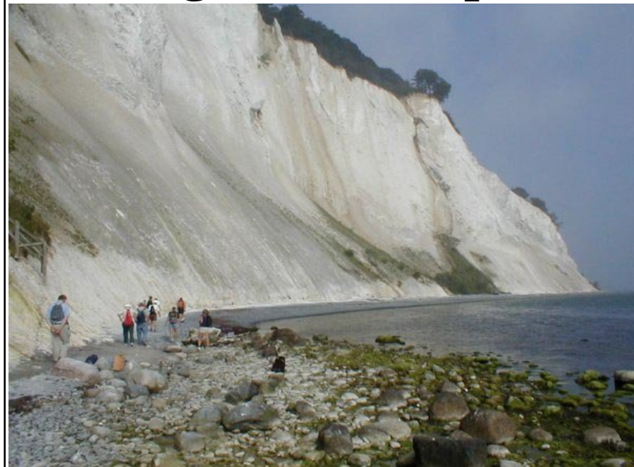
Nogle af stenklubbens medlemmer ved den imponerende 128 m høje Møns Klint